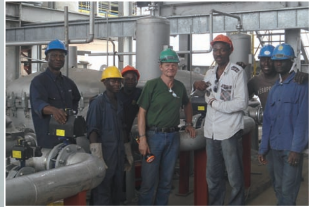
Projekt Golden Sugar, Nigeria: Vorfertigung und Supervising der Edelstahlrohrleitungen für eine Zuckerfabrik

Für Australien wurden Behälter aus Lean Duplex vorgefertigt und mit unserer Unterstützung montiert