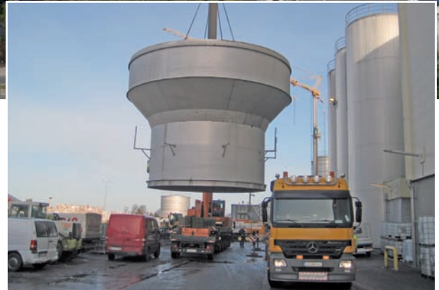
Umbau der Multiproduktanlage PM4 bei der Papier- und Kartonfabrik Varel: Stapeltürme, Behälter, Stoffaufläufe und Ausschusspulpertröge